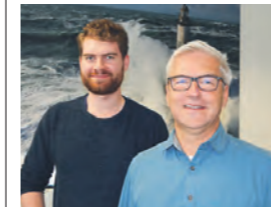
Ihr Team in Ritterhude