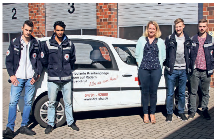
Ein ganzes Team kümmert sich beim DRK um die Bestellung, Koordination und Lieferung der Essen zum Kunden.

Das Essen wird täglich mit drei Touren in den Landkreis geliefert. Jeder Kunde erhält bei der ersten Lieferung eine Wärmebox, die er an einem vereinbarten Abstellort, beispielsweise vor der Haustür, deponieren kann, damit der Auslieferungsfahrer das warme Essen dort hineinstellen kann. Selbstverständlich erfolgt die Lieferung aber auch bis in die Wohnung des Kunden und wird persönlich ausgehändigt.