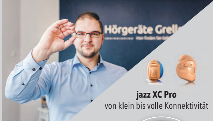
jazz XC Pro von klein bis volle Konnektivität